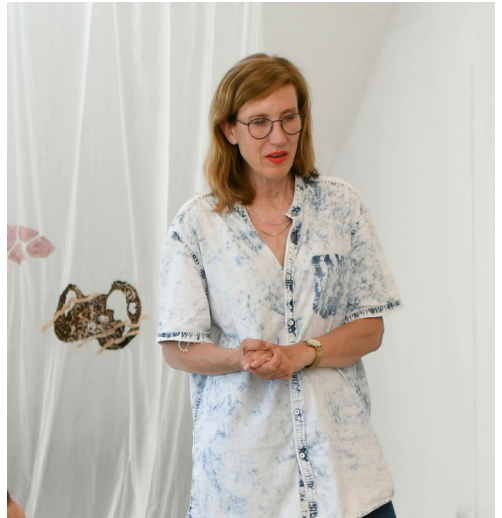
Prof. Caroline Achaintre

“I think textile is an exciting material because it is not neutral, but has a temperature right away. For example, it can be repulsive and attractive at the same time, or tell a story through the process the material has gone through. Artistic works are often based on opposites, such as a combination of planning and experimentation. Uncertainty can be an important part of that.”