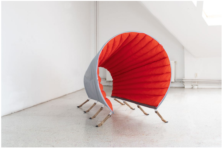
Veronika Weber Heidi , 2020 Zeltstoff, Rehläufe, Aluminium, Watte Tent fabric, deer runs, aluminum, absorbent cotton