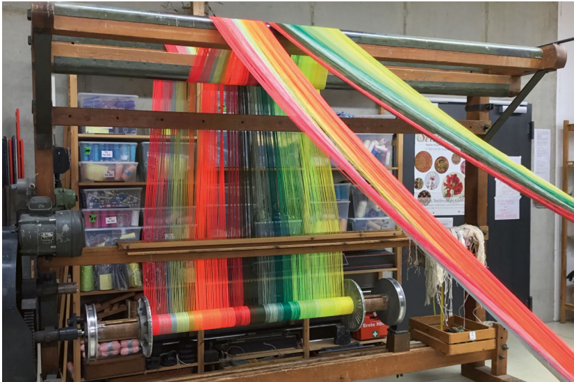
Bäumstuhl mit Webkette Beaming frame with warp