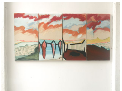
Karl Gustav Steinig o.T. (schwimmende stücke) Untitled (floating pieces), 2021 Öl auf Leinwand Oil on canvas