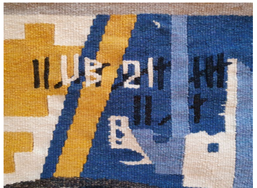
Ulrike Basner CatusBoi , 2021 Gobelin, Detail Tapestry, detail