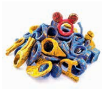
TALENTE - Jordan Furze