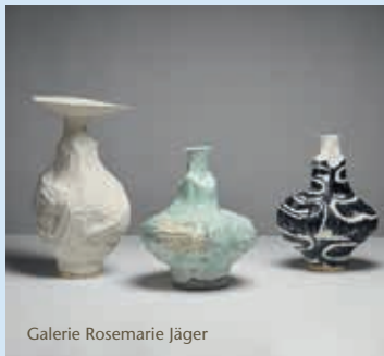
Galerie Rosemarie Jäger