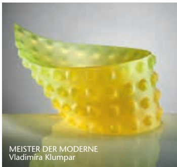
MEISTER DER MODERNE Vladimíra Klumpar