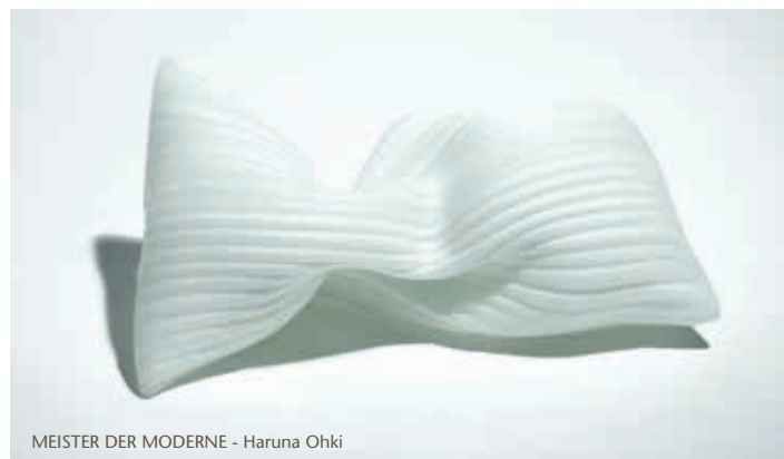
MEISTER DER MODERNE - Haruna Ohki

Die Auswahl wurde von der Abteilung für Messen und Ausstellungen der Handwerkskammer für München und Oberbayern zusammengestellt, messe@hwk-muenchen.de