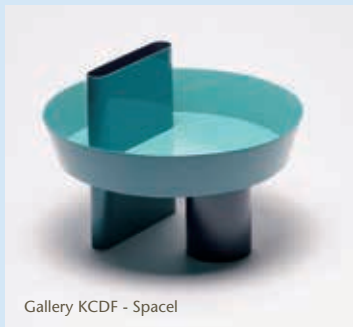
Gallery KCDF - Spacel