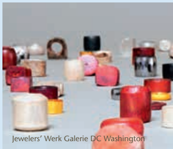
Jewelers' Werk Galerie DC Washington