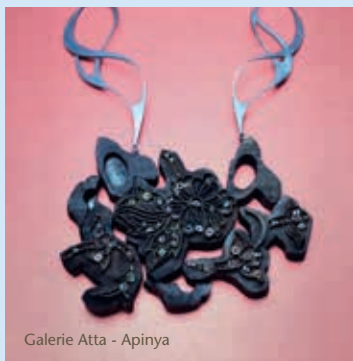
Galerie Atta - Apinya