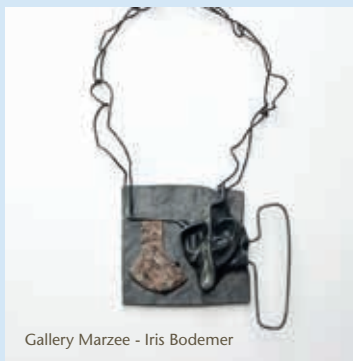
Gallery Marzee - Iris Bodemer