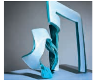
MEISTER DER MODERNE - Anda Munkevica