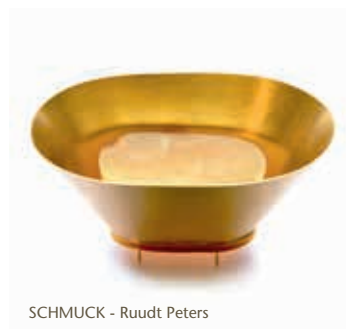
SCHMUCK - Ruudt Peters