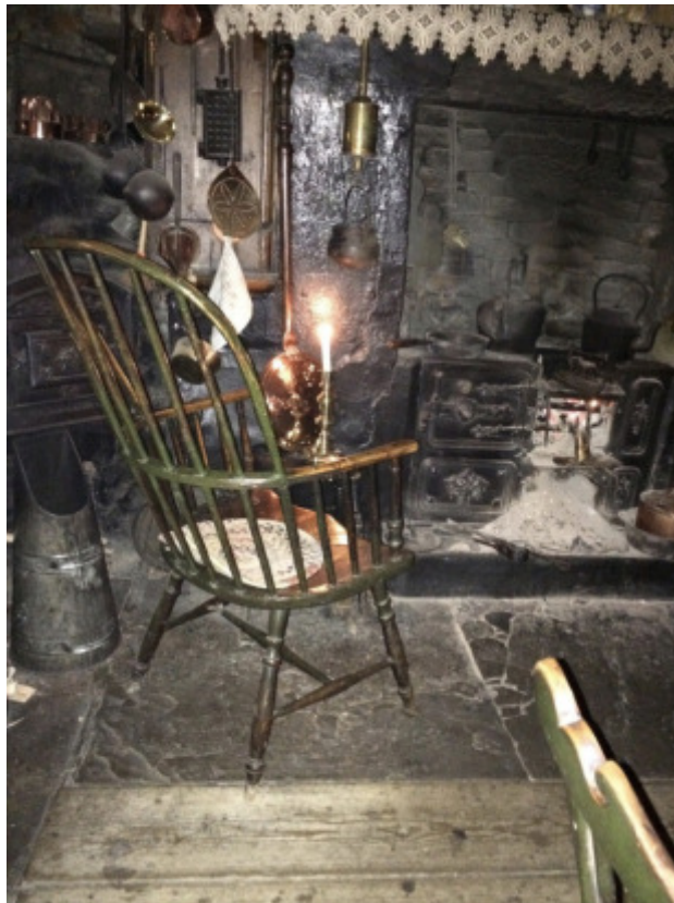
Stuhl in der Küche des Dennis Severs' House

Ich nenne diesen Programmpunkt zuerst, obgleich er am Mittwoch, nur fakultativ und d.h. nur von einigen besichtigt wurde, weil er sehr gut die Paradoxa des Sammelns illustriert; gerade auch die Sehnsucht, die ihm eingeschlossen ist. Diese Sehnsucht wurde gleichsam „nackt“ greifbar im Dennis Severs’ House, das am Samstag Abend für alle auf dem Programm stand. [Ich gehe in meinem Bericht der Kohärenz halber thematisch, nicht chronologisch vor.]