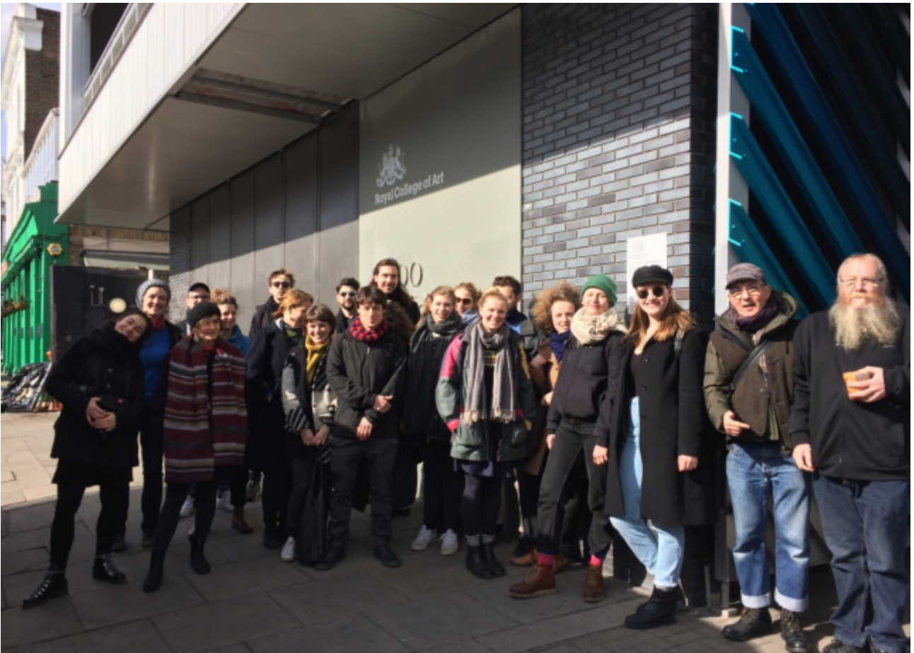
Gruppenbild vor dem RCA