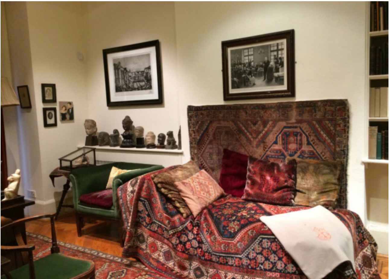
Patienten-Couch im Freud-Museum