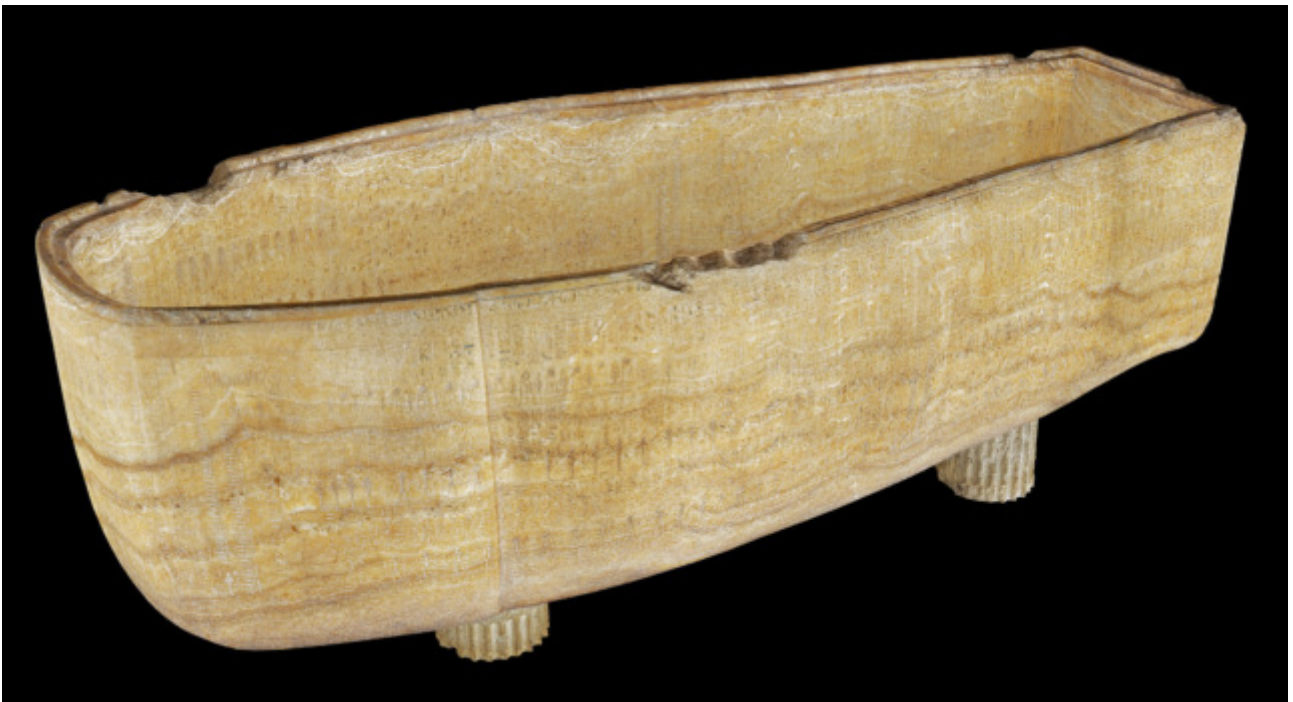
Sarkophag Seti I. im John Soane Museum