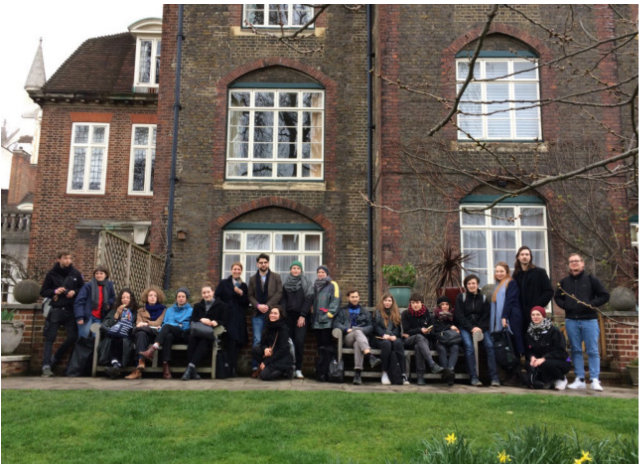
Gruppenbild im Garten von Westminster Abbey

Der Donnerstag führte uns in die einzige klassische Touristenattraktion, die Westminster Abbey. Gerne hätten wir die noch existenten Wachseffigies der verstorbenen Könige samt ihrer vielschichtigen Kostüme bewundert – allein, die Queen’s Diamond Jubilee-Gallery wird erst im Juni 2018 von der Queen eröffnet, 70ft. Über dem Boden, auf dem sog. Triforium, das 700 Jahre nur vom Klerus betreten werden dürfen. Unter, zwischen all den anderen Gruppen jedoch, waren wir ohne Audio-Guide etwas verloren, es gelang aber einigen, mit dem Reverend ins Gespräch zu kommen und interessante Details gerade über die Königsgräber zu erhalten; der ägyptische Totenkult wirkte und hallte hier noch einmal auf ganz andere Weise nach; während andere es vorzogen, Oliver Cromwells unrühmliche, da nur temporäre Grablegung (auf die immerhin noch ein Stein in der Apsis verweist) zum Anlass zu nehmen, beizeiten das Freie in den angrenzenden Kreuzgängen und Gärten zu suchen.