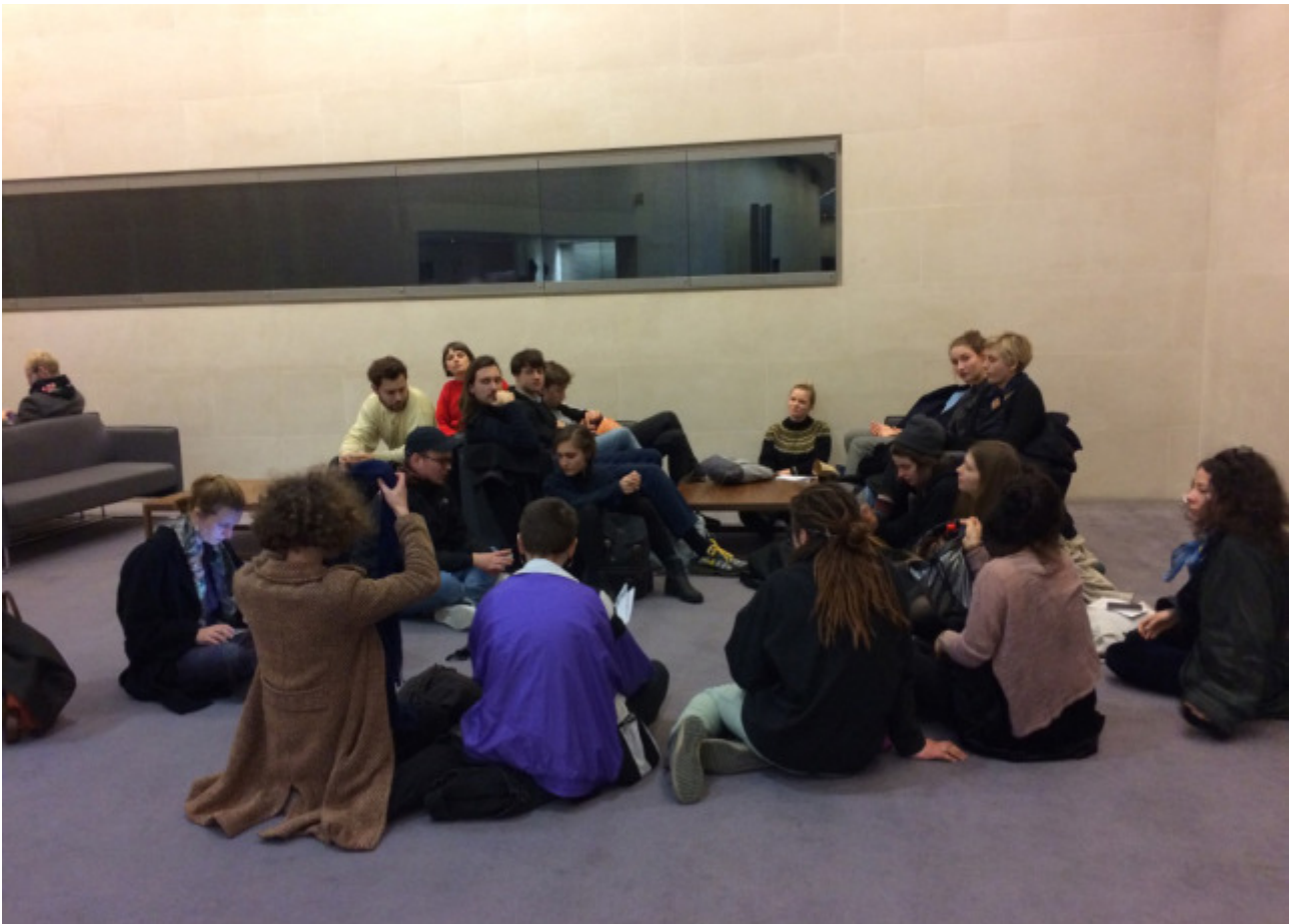
Referate im British Museum