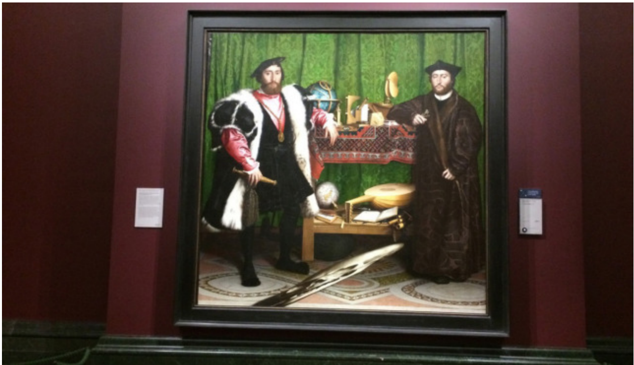
Hans Holbein: Die zwei Gesandten, National Gallery

Die „Sprache“ der ausgestellten Dinge auf Holbeins »Gesandten« zusammen mit der Mahnung des Totenschädels, die gerissene Saite, die führte zu interessanten Spontandiskussionen unter denen, die sich zufällig vor dem Bild wiedertrafen.