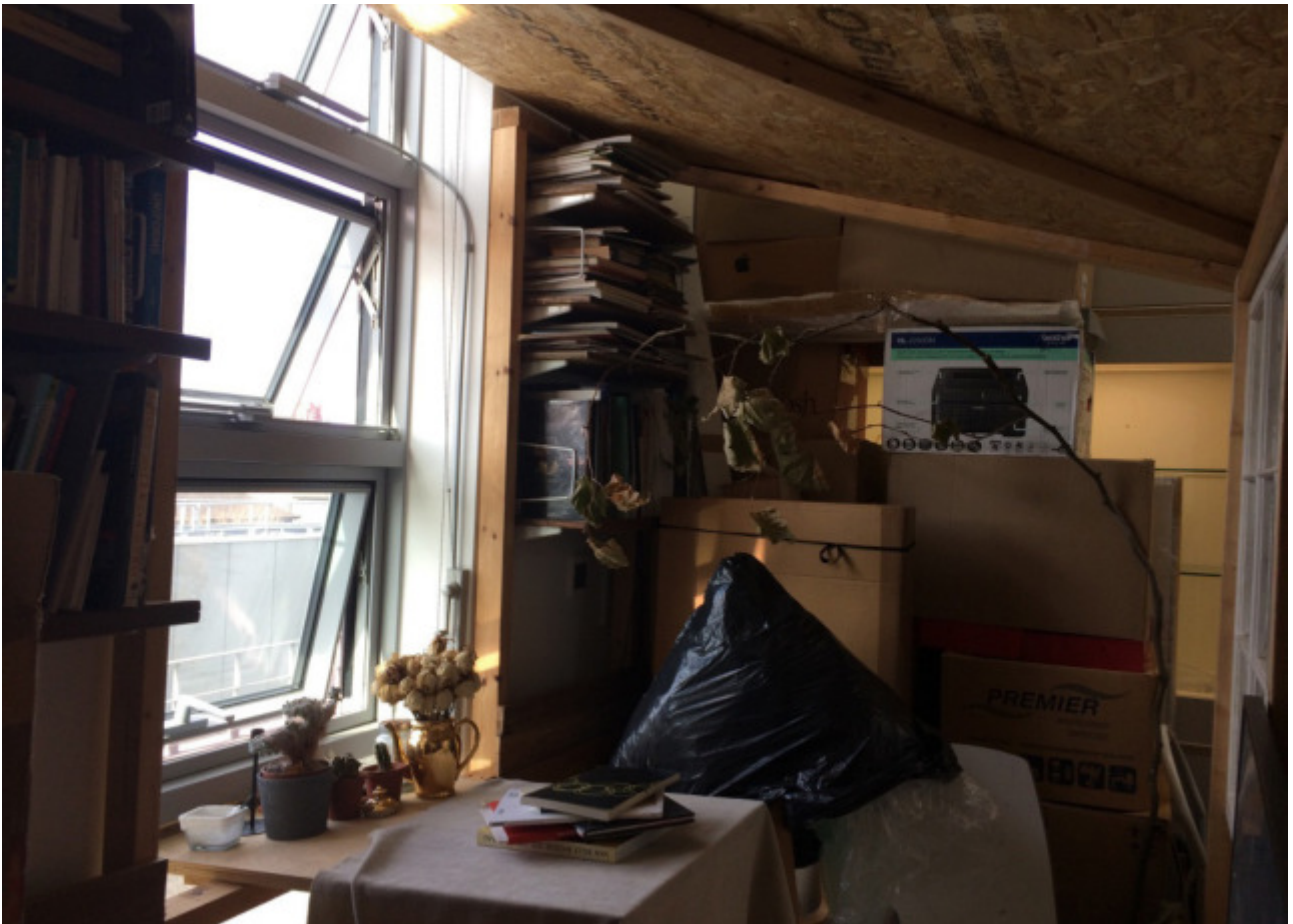
Lese-Hütte im Atelier der Schmuck-Klasse, RCA

significant I need to write it down. It is significant down. It is significant I need to write it need to write it down. It is significant I need significant I need to write it down. It is signifi down. It is significant I need to write to write it down. It is significant I need to tificant I need to write it down. It is signifi