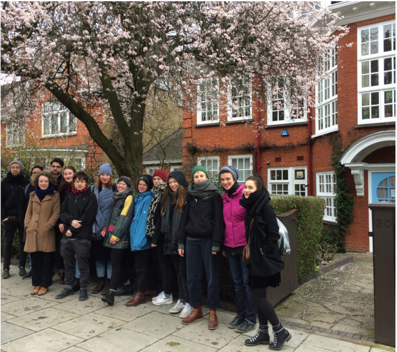
Die Besucher des Freud-Museums unter blühenden Bäumen im Schnee

Denn das letzten Wohnhaus Freuds enthält eine erstaunliche Zahl griechischer Vasen, ägyptischer Reliefs, Totemfiguren und Shabties (Stellvertreterfiguren) und versammelt alles im Kleinen, was wir aus den ersten beiden Tagen im British Museum bereits kannten. Interessant war für uns zu sehen, wie Freud seine eigene Sammlung vergangener Hochkulturen täglich gebrauchte: So sprach er mit seiner Lieblingskulptur und nahm immer eine andere von ihnen mit zum Essen, wo er vermutlich gewöhnlich schweg, versunken im stummen Dialog mit der Statue. Unglaublich berührend fanden wir, wie Freud sein Behandlungszimmer inszenierte: Die Analysanden lagen nicht einfach auf einer Couch, während er zuhörend die kleinen Totems auf seinem Schreibtisch betrachtete, sondern auf ornamentalen Berberteppichen und schauten ihrerseits auf einen prächtig gefransten Kamelteppich, der einst eine Braut zur Hochzeit bringen sollte, während auf einem kolorierten Photo über ihnen die Kolossal-Statuen von Abu Simbel gnädig auf die gesamte Szene hinab lächelten. Für Freud waren sie buchstäbliche „Väterfiguren“, Wächter über das Vergangene, Unterdrückte, Unbearbeitete. Dass für das Verständnis der Psychoanalyse Analogien zu den Symbolen der Mythologie essentiell ist, wussten wir bereits, dass aber das „Graben“ in den Abgründen der eigenen Psyche von Freud selbst so buchstäblich archäologisch zu verstehen ist, überraschte uns schon.