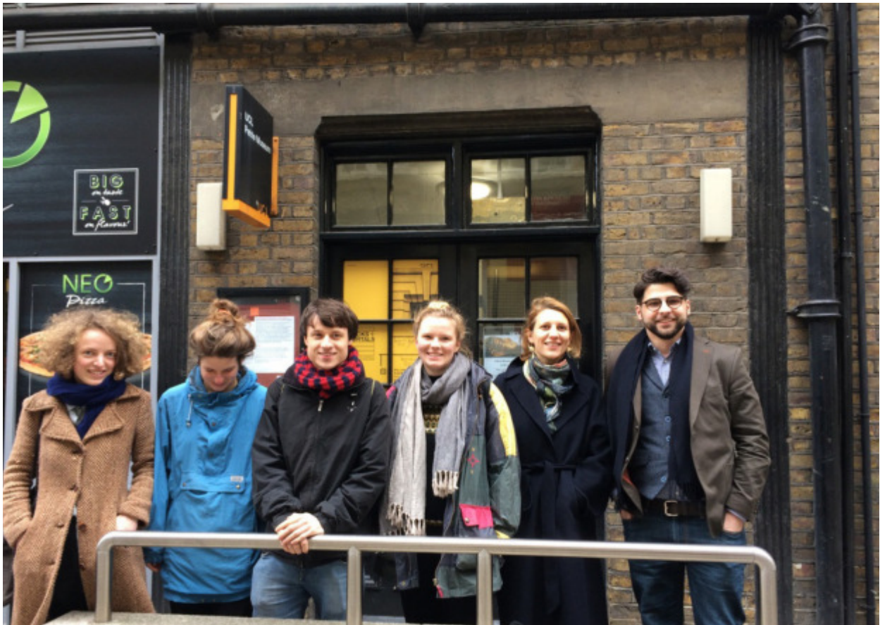
Vor dem ägyptologischen Petri Museum

Im Seminar lasen wir vor allem die klassischen, (kultur)-philosophischen und psychoanalytischen Texte zum Dingbegriff: Heideggers „Die Frage nach dem Ding“, Gadammers Ausführungen dazu (und dem Spielbegriff) aus Wahrheit und Methode II , die für unsere Ohren seltsam unordentlich anmutende „chinesische“ Ordnung, wie sie Foucault am Anfang der Ordnung der Dinge, aufzählt; Auszüge aus Baudrillards System der Dinge und natürlich Aby Warburgs Schlangenritual und Freuds Anmerkungen zum Fetischismus des Sammlers.