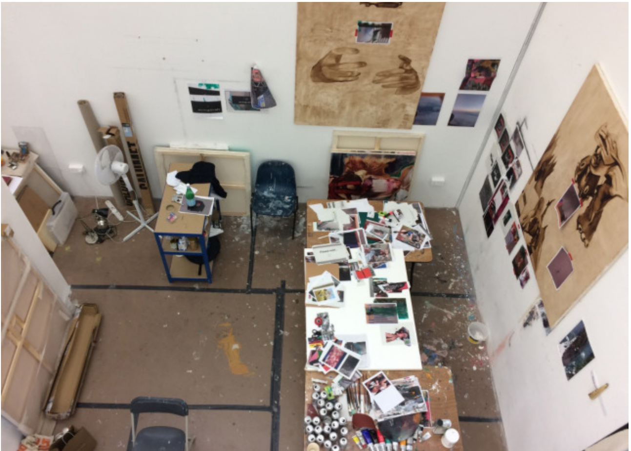
Blick in ein Maler-Atelier, RCA