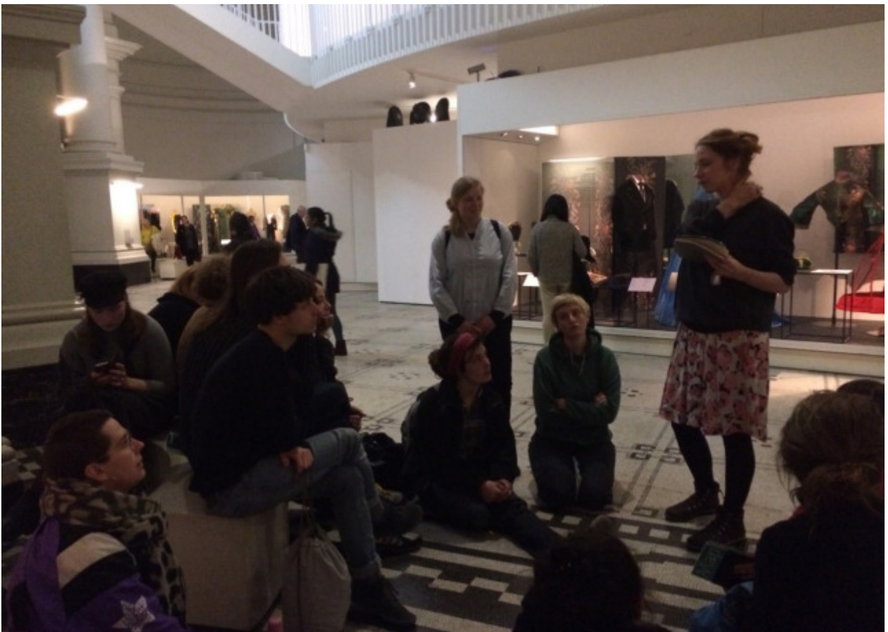
Referat von Veronika Raupach im V&A