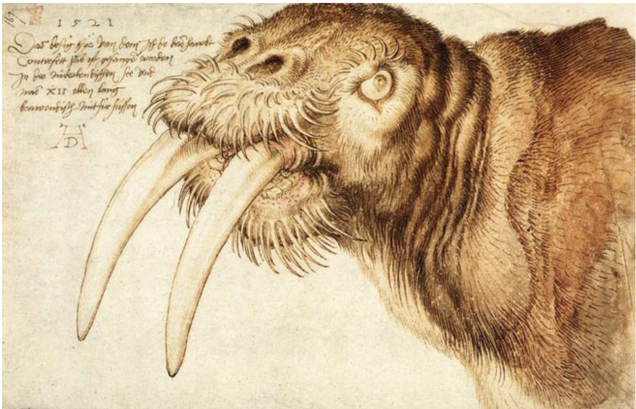
Albrecht Dürer: Walross (1521), heute London, National Gallery