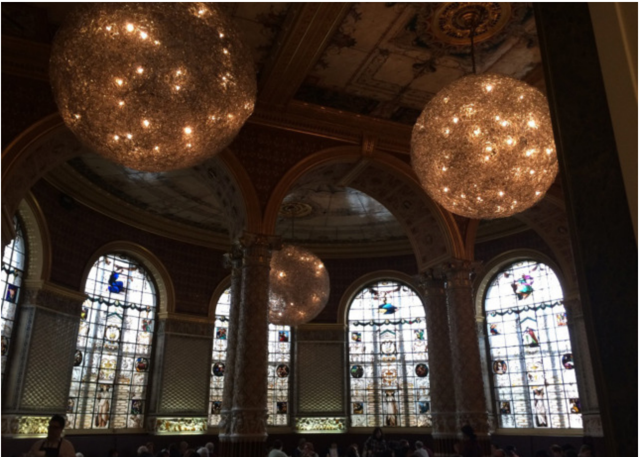
Café im V&A