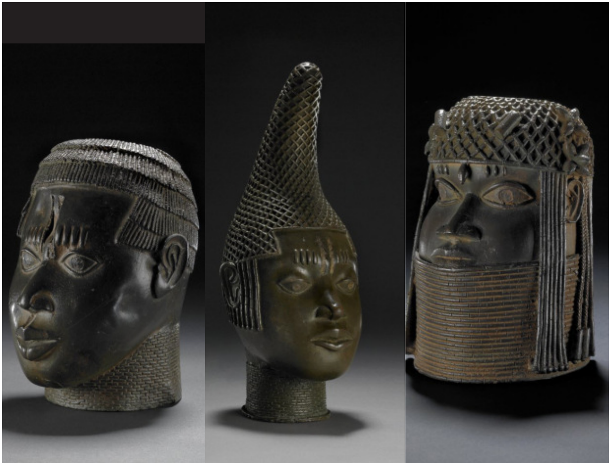
Köpfe von Benin

Führung sahen, erläuterte der britische Guide traurig, dass man im Großbritannien der Jahrhundertwende die Köpfe Bildhauern des sagenumwobenen Atlantis zuschrieb, weil man sich beim besten Willen keine afrikanische Stammeskultur vorstellen konnte, die mit verlorenen Wachsformen und anderen Gußtechniken vertraut war.