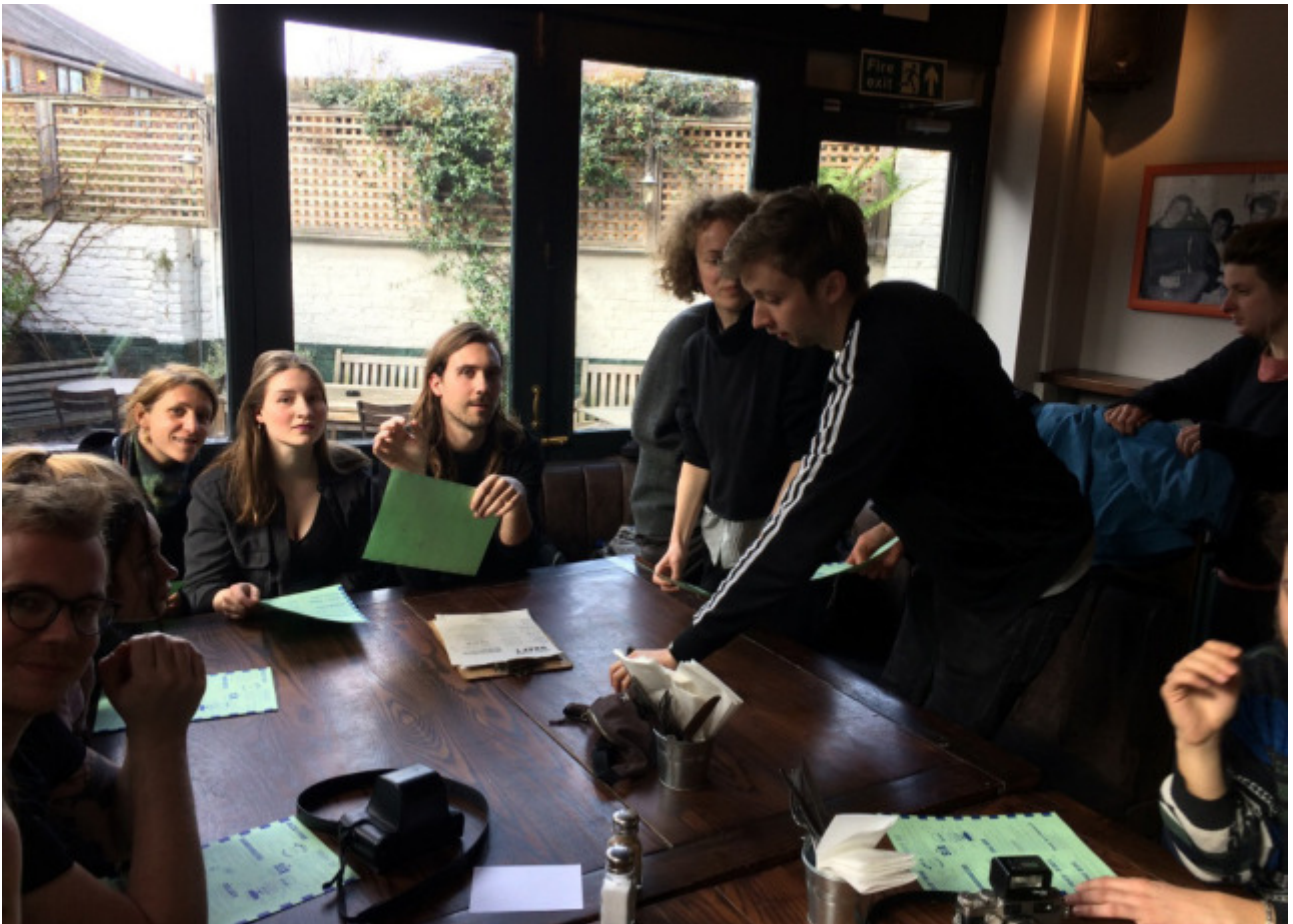
Im Pub nach der Besichtigung des RCA