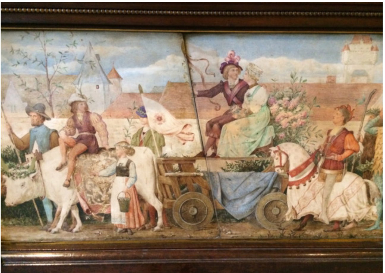
Detail, V&A © Mirjam Schaub. 23