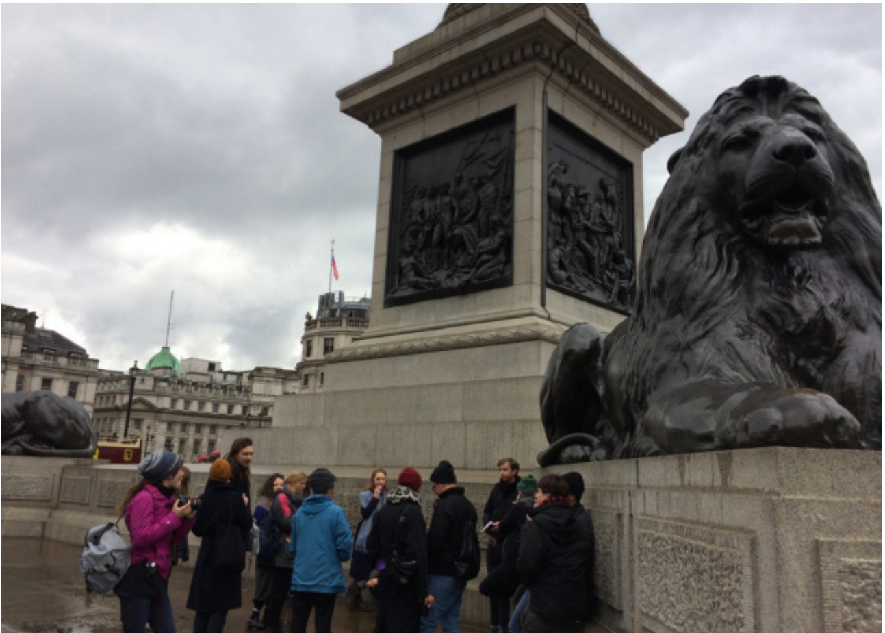
Referat auf und über den Trafalger Squire