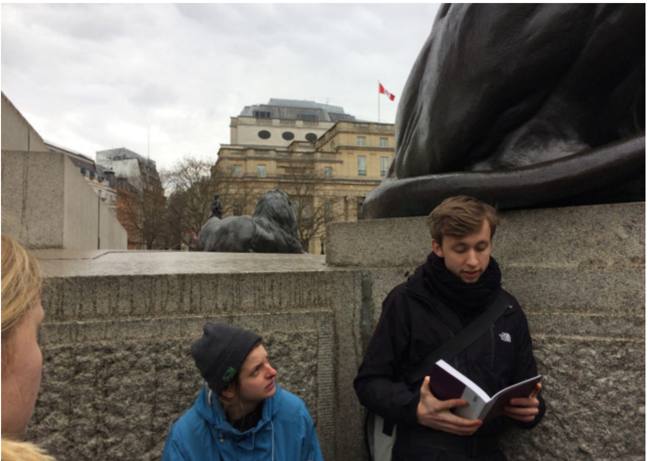
Referat auf und über den Trafalger Squire