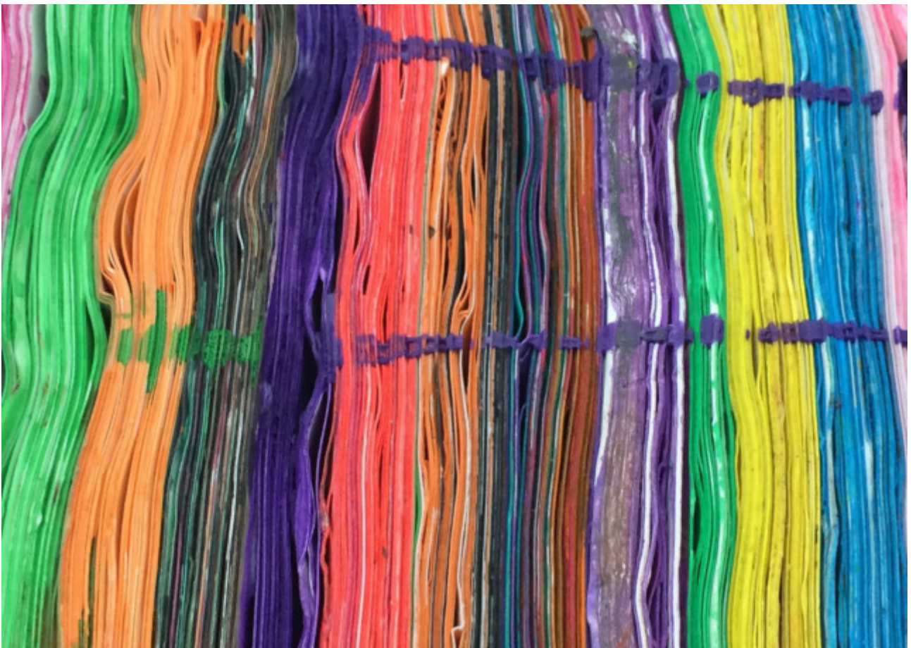
Detail, RCA.