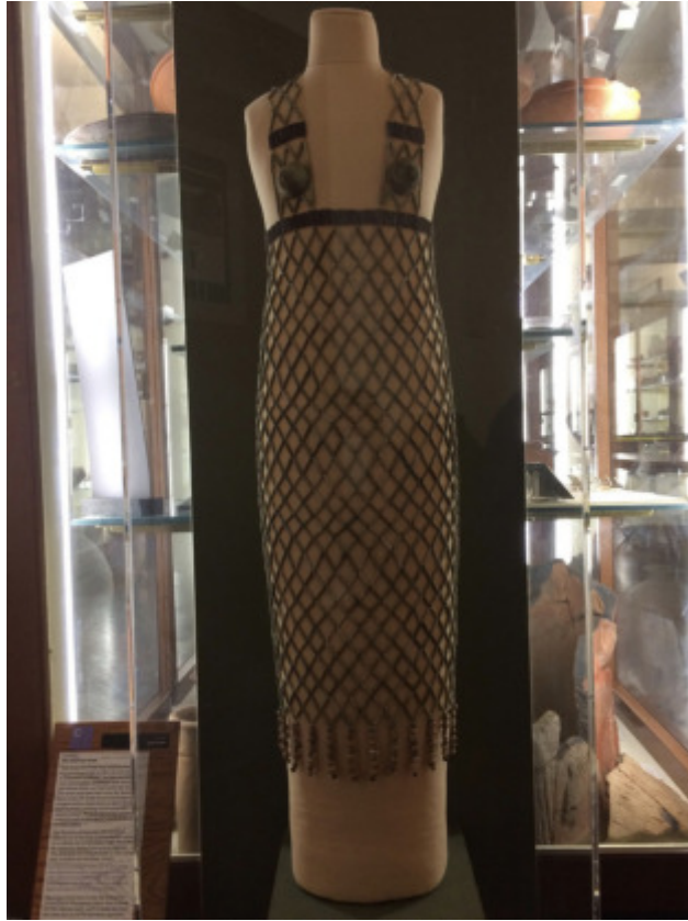
Kleid einer Tänzerin im Petri Museum