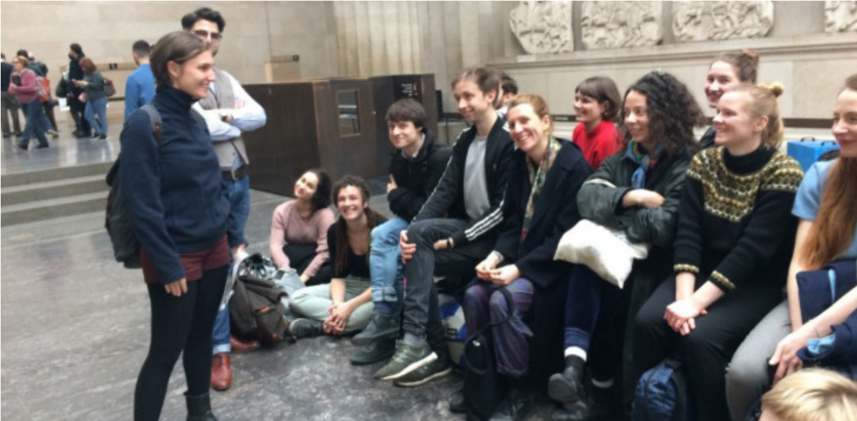
Raum der Elgin Marbles im British Museum

Die Debatte über die Restitutionsen der „Elgin Marbles“ versuchten wir differenziert zu führen; denn nicht jeder Kunstraub führt durch spätere Restitution zu Wiedergutmachung, zu mehr Gerechtigkeit oder Kunsterhalt: So würde der Markusdom in Venedig vermutlich einstürzen, wenn man all seine Raubschätze entfernte, ohne dass das alte Konstantinopel parallel wieder auferstünde ... Auch macht es vermutlich einen Unterschied, ob die Fest-Prozession entlang des inneren Säulenhalle des Parthenon als in Stein gehauene kultische „Gebrauchsanleitung“ dieses Gebäudes auf die Akropolis zurückgelangt, oder ob ein einzelnes Meister- und Demonstrationsstück – wie die Nophretete – statt an ihrem Fundort in der zerstörten Werkstätte eines ägyptischen Bildhauers, im Rahmen einer Ägyptensammlung gezeigt wird. Im Fall der gegossenen und bereiften, enigmatischen Köpfe aus Benin, die wir im Rahmen einer „best of“