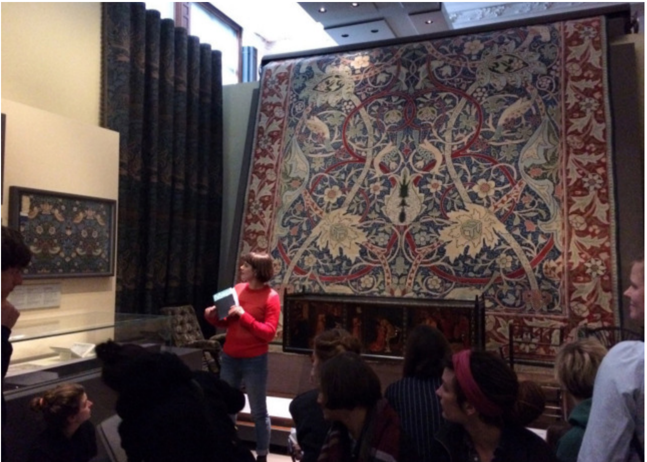
Referat von Mia Kugelman im V&A