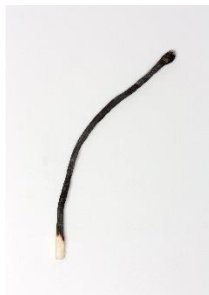
Maria Kiialainen Streichholzinvaliden, 2018 Fotografie und Buch