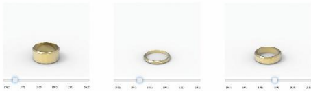
Klemens Schillinger (*1983, Österreich) Element 79 - Aurum charts