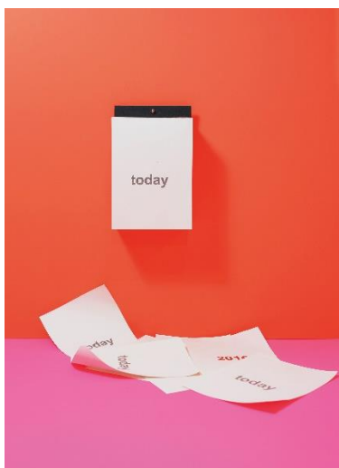
Moritz Jähde (*1991, Deutschland) Kalender mit speziellem Mechanismus