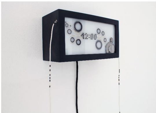
Felix Vorreiter (*1978 in Hamburg, Deutschland) FLUX 1440