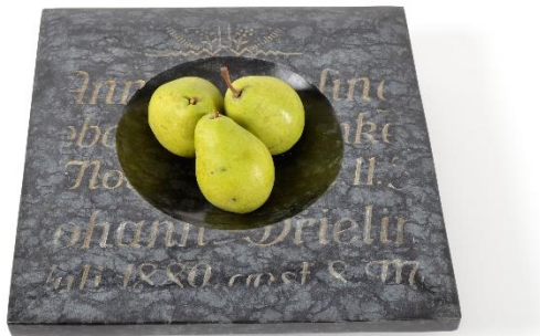
Jan-Dirk Wolken (*1984 in Ostfriesland, Deutschland) Gedenkschale aus Naturstein