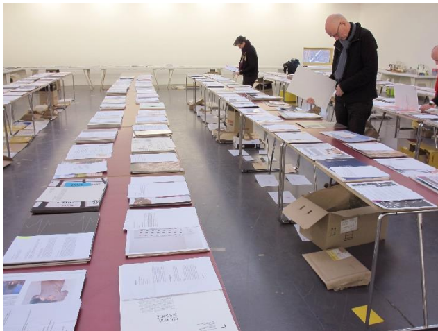
Während der Jurysitzung zum Designpreis Halle 2017