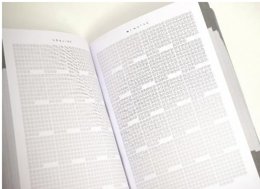
Bernhard Wilke (*1981, Deutschland) 30758400