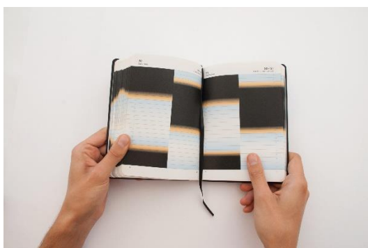
María Marín de Buen (*1986 in Mexico City, Mexiko) Alternative Temporalities, Exploring the Visualization of Time

Abdruck und Verwendung der Pressebilder nur im Rahmen einer aktuellen Berichterstattung. Die Abbildungen dürfen nicht beschnitten oder manipuliert werden. Bei Verwendung sind der Urheber des Werks und die bereitgestellten Quellenangaben vollständig zu nennen.