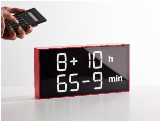
Axel Schindlbeck (*1981) Albert Clock, 2015 Foto: Gerhardt Kellermann © Axel Schindlbeck