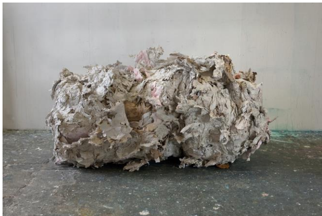
Christoph Liedtke Tzimtzum, 2017 Akkumulation aus Papier und Karton © Christoph Liedtke Foto: Christoph Liedtke