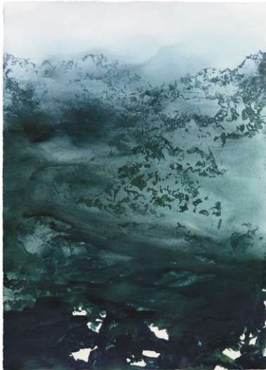
Simone Distler Ohne Titel, 2016 Mischtechnik auf Papier, 140 x 100cm © Simone Distler Foto: Simone Distler